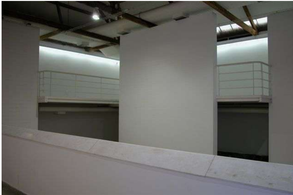
Fig. 3: galeria e mezanino vista a partir do acesso ao museu