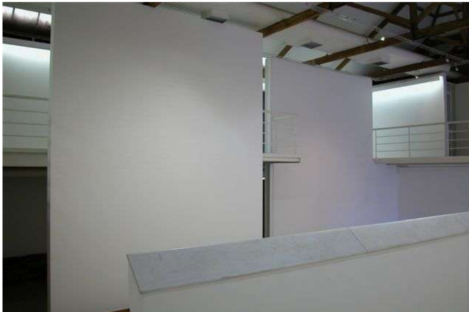
Fig. 4: galeria e mezanino