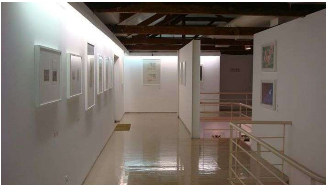
Fig. 13: mezanino em uso da exposição “Variações e afinidades” e acesso para a sala Lucimar Bello (à direita na foto), maio de 2014