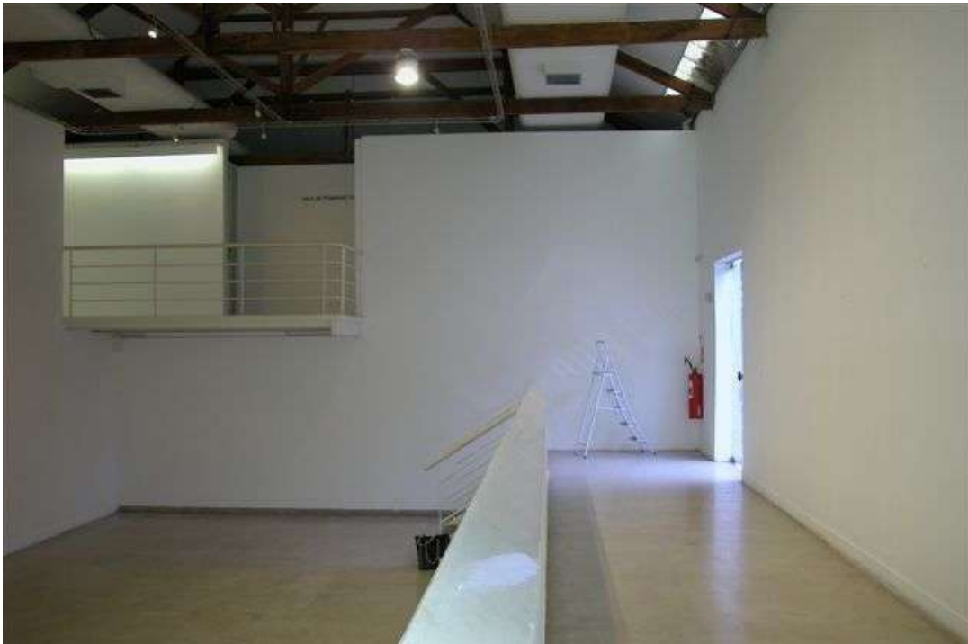
Fig. 7: galeria, mezanino e acesso ao museu – obs.: no lugar da escada dobrável funciona a recepção