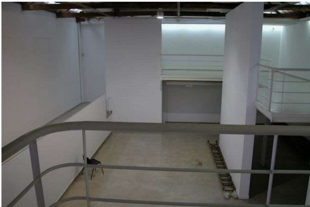
Fig. 10: galeria e mezanino