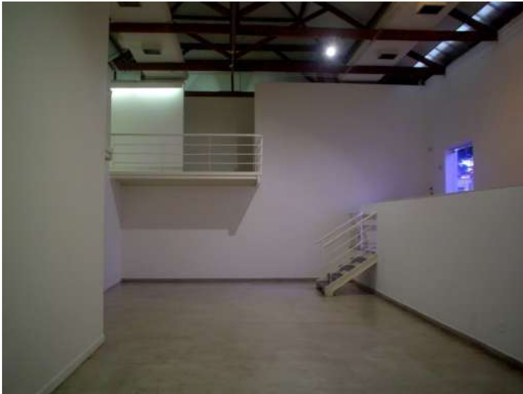
Fig. 5: galeria, mezanino e entrada do museu