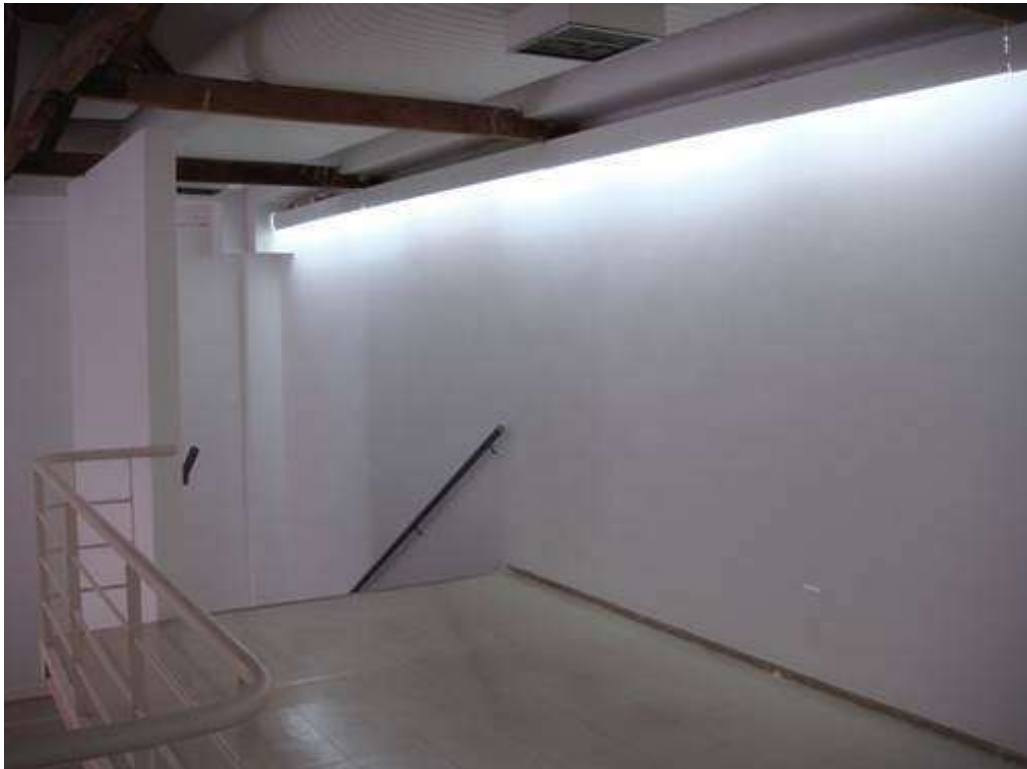
Fig. 11: mezanino