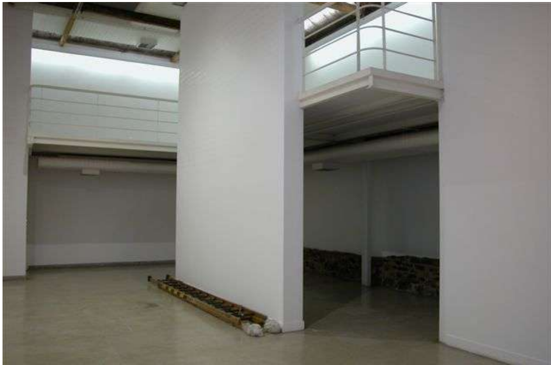
Fig. 9: galeria e mezanino