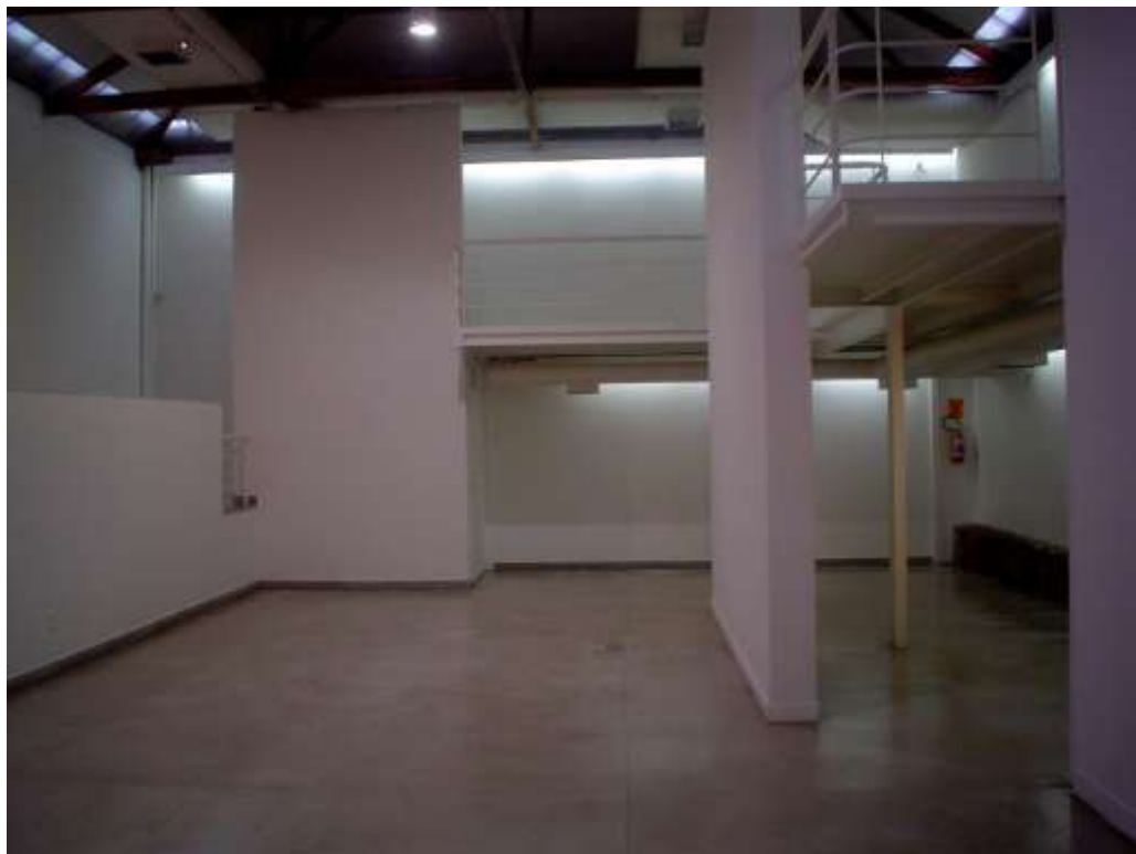
Fig. 6: galeria e mezanino