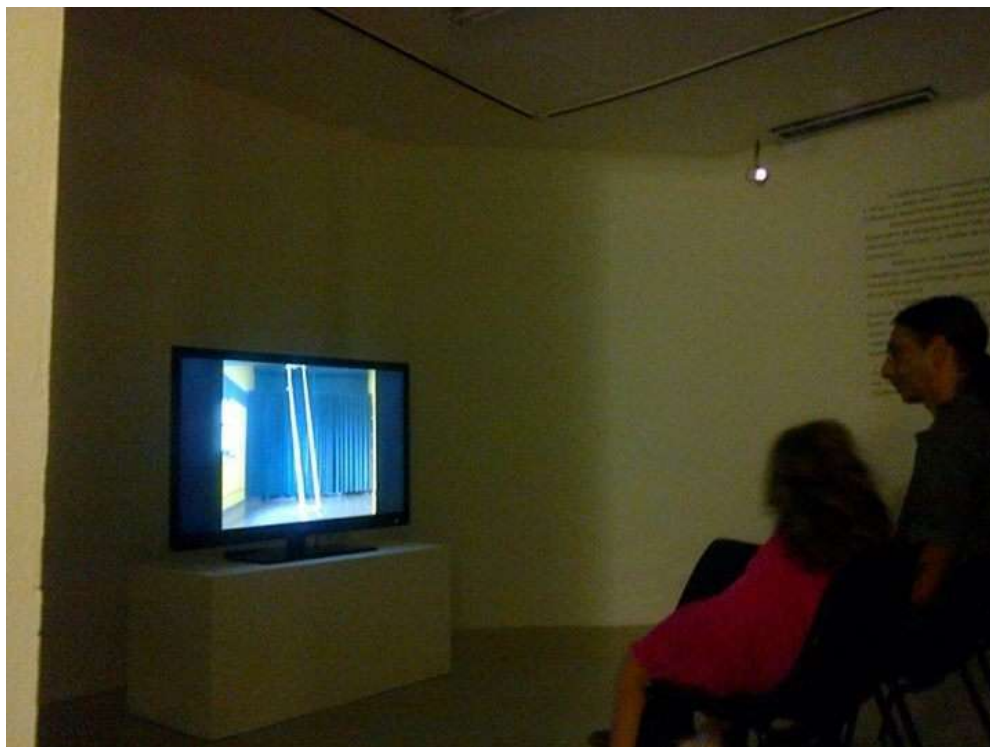
Fig. 15: sala Lucimar Bello em uso para exposição de videoarte, maio de 2015.