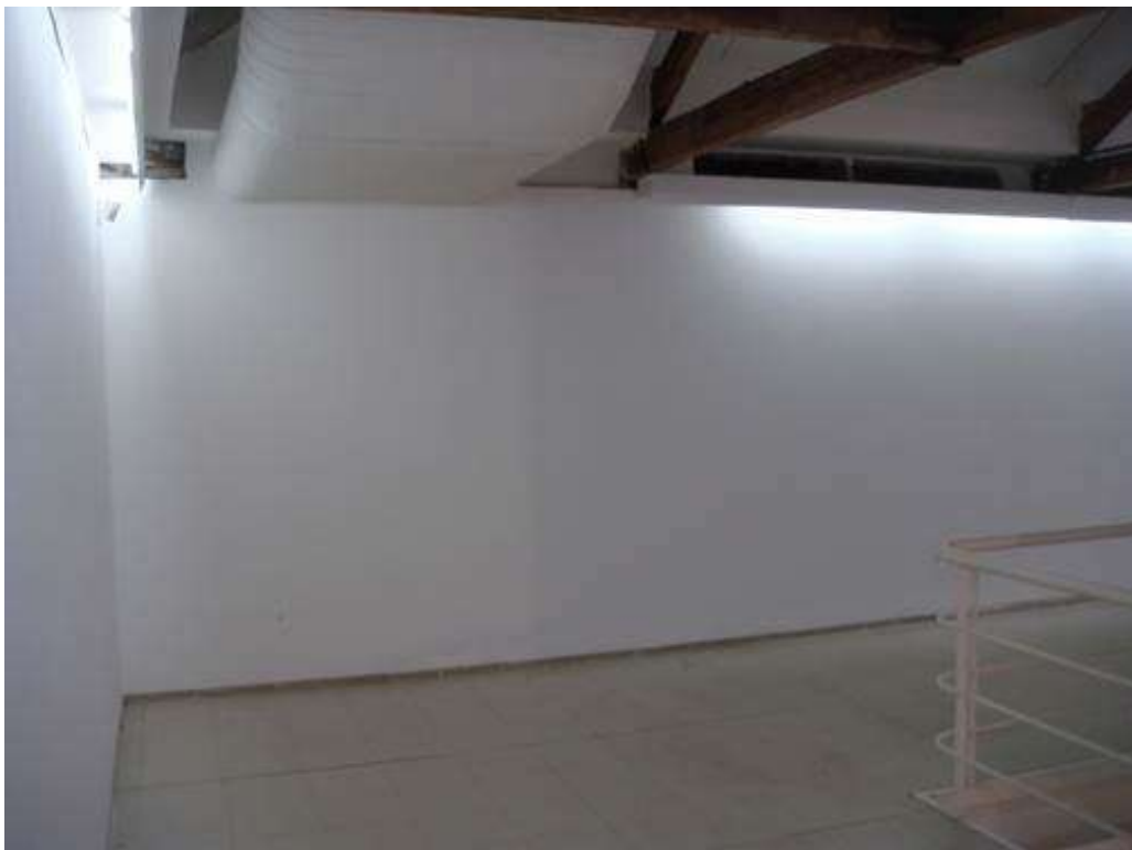
Fig. 12: mezanino