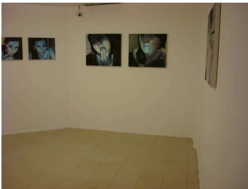
Fig. 14: sala Lucimar Bello em uso de exposição pinturas, novembro de 2013 (obs.: a pintura padrão da sala é na cor branca, conforme a fotografia)