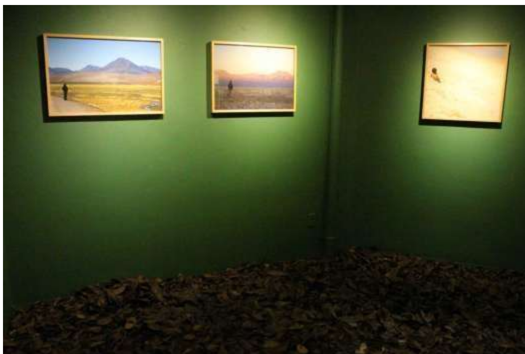
Fig. 16: sala Lucimar Bello em uso da exposição “Abismos contemplativos da memória”, da artista Heloísa Junqueira, maio de 2015 (obs.: neste caso, a pintura verde das paredes foi feita por conta da artista, que ao término da exposição repintou as paredes de branco)